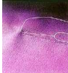
صورة (11) غرزة تثبيت الكسرات