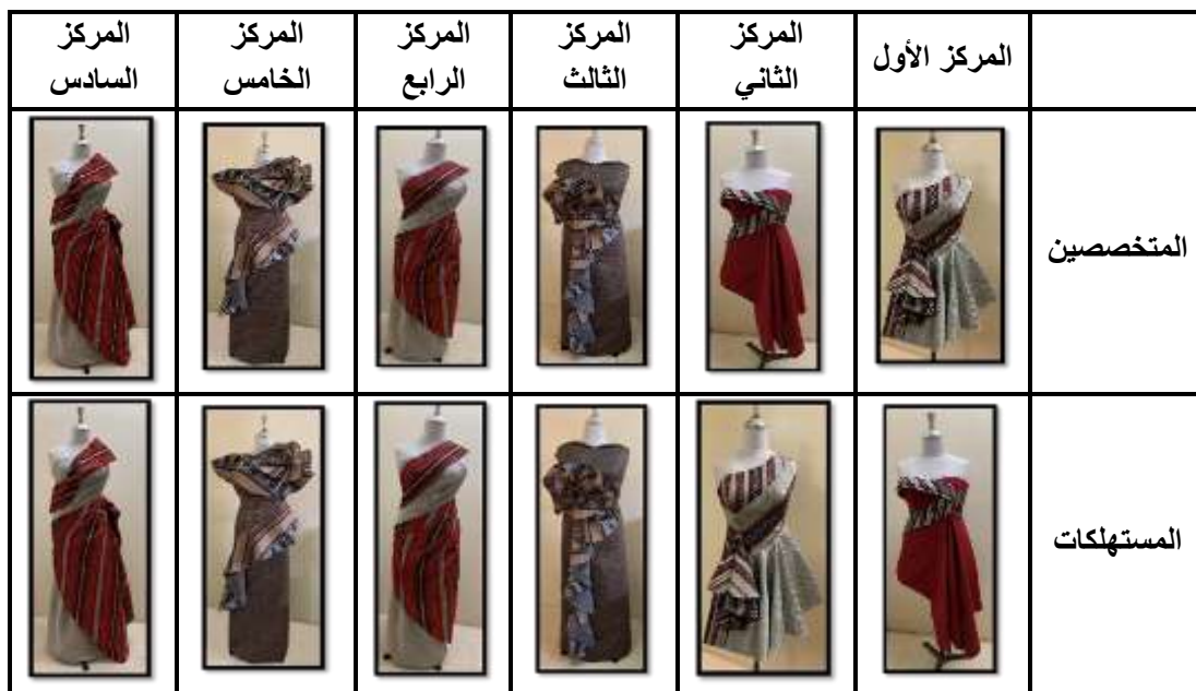
جدول (9) ترتيب التصميمات تبعاً لآراء المتخصصين والمستهلكات

والجدول التالي يوضح ترتيب التصميمات وفقاً لآراء المتخصصين والمستهلكات: