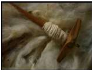
صورة (1) التغزلة والمغزل www.almustagbal.com

الساحة: يشبه سدو الساحة سدو القاطع إلى حد ما إلا أنه يختلف عنه في أن القاطع يتكون من أجزاء مختلفة الألوان أما سدو الساحة فيتكون من سدو واحد فقط ملون، ويختلف طوله وعرضه تبعاً للهدف الذي يسدى من أجله. (الغانم، دلال – 1987 – 63)