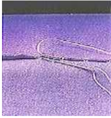
صورة (12) غرزة اللفق اليدوية

وللإجابة على التساؤل الخامس فقد تم تنفيذ التصميمين (الأول والخامس) اللذان حصلوا على أعلى الدرجات من وجهة نظر المتخصصين والمستهلكات، ويوضح ذلك فيما يلي: