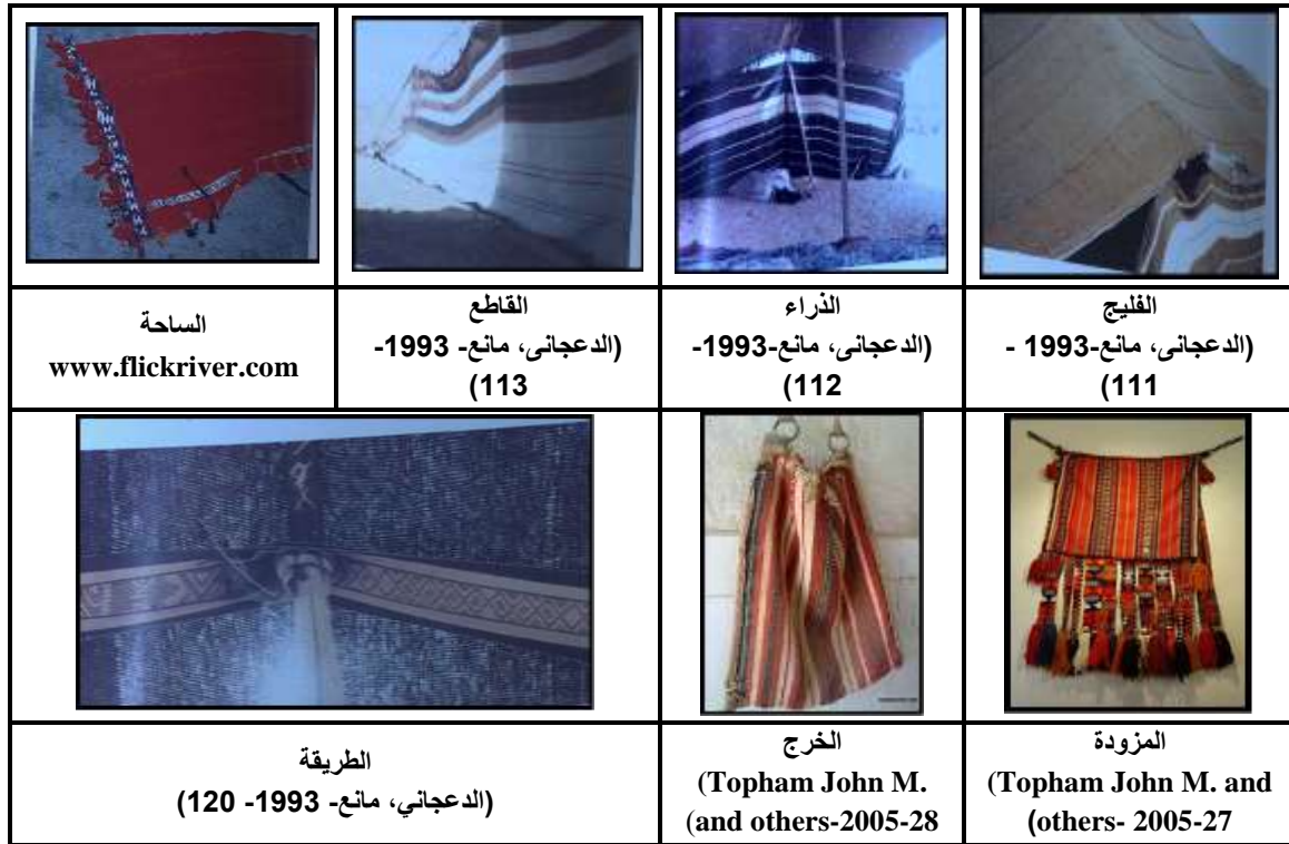
صورة (2) أنواع السدو